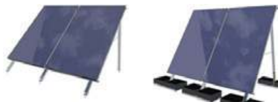
Přímé kotvení do podkladu