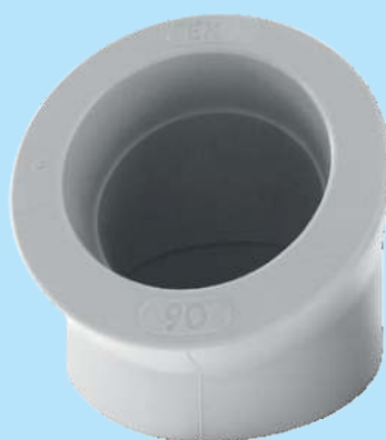
Koleno 45°, 90 mm, PPR