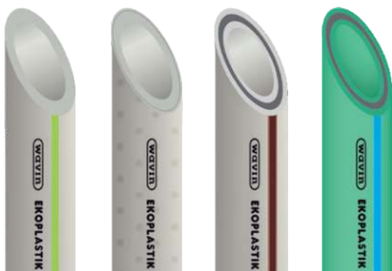
Ekoplastik EVO PP-RCT